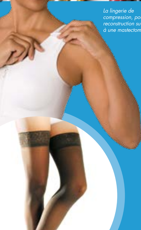
La lingerie de compression, pour reconstruction suite à une mastectomie.