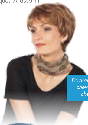
Perruques «tendance» cheveux courts ou cheveux longs