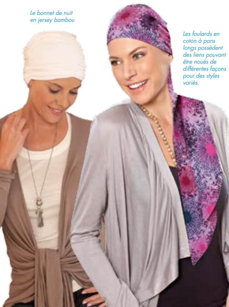
Les foulards en coton à pans longs possèdent des liens pouvant être noués de différentes façons pour des styles variés.