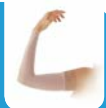
Le manchon de compression réduit l'oedème.